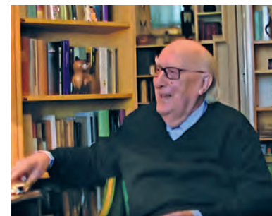
Andrea Camilleri dialoga con i rappresentanti di Igea durante l'incontro del novembre 2012, prima di registrare il videomessaggio pubblicato a pag. 2.

L'incontro si concluse con una bella foto