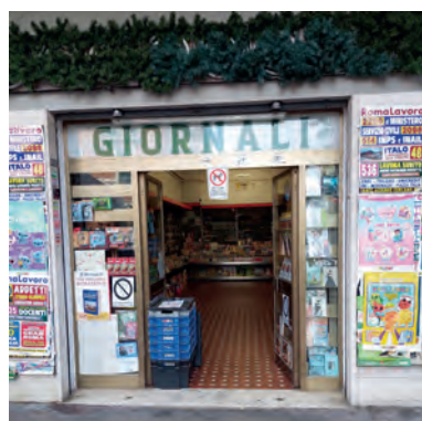
L'edicola Antinorelli in via Torrevecchia, 85.

IGEA NELLA LIBRERIA: IL SEME - Via Monte Zebio, 3