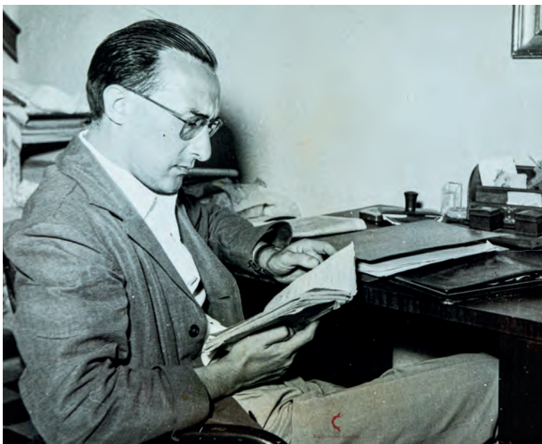
Foto di Camilleri giovane.

In essa egli esprime il suo apprezzamento a tutte le associazioni di volontariato che, come la nostra, tanta importanza hanno nella partecipazione civile alla vita democratica, aggiungendo un plauso speciale alla nostra idea di voler dar vita ad un concorso letterario che punti alla valorizzazione della sintesi narrativa. Con