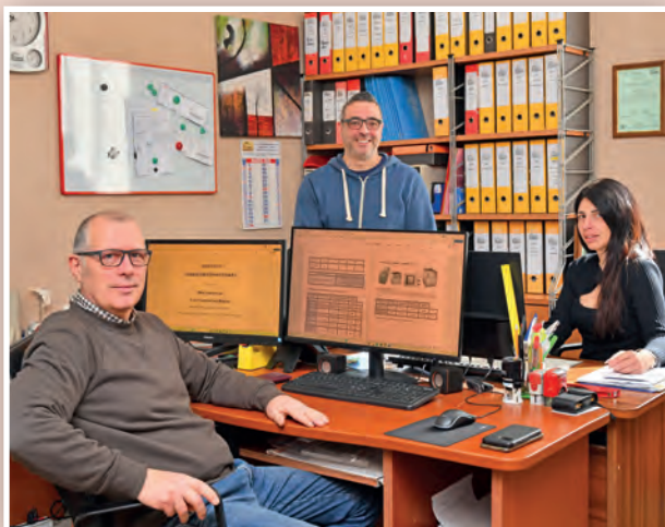
Lo Staff dello Studio.