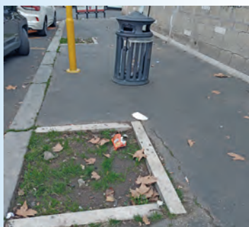
Due immagini che ritraggono due delle buche lasciate senza alberi.